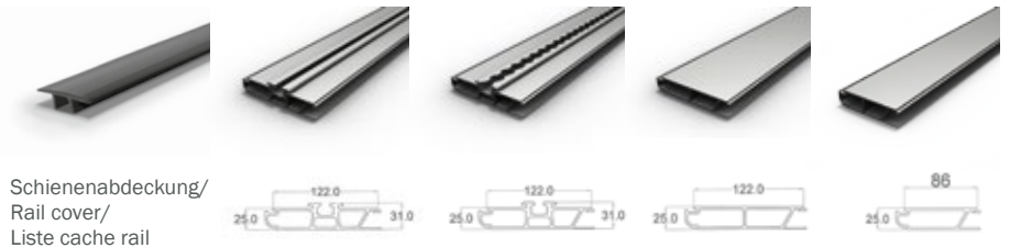
Schienenabdeckung/ Rail cover/ Liste cache rail